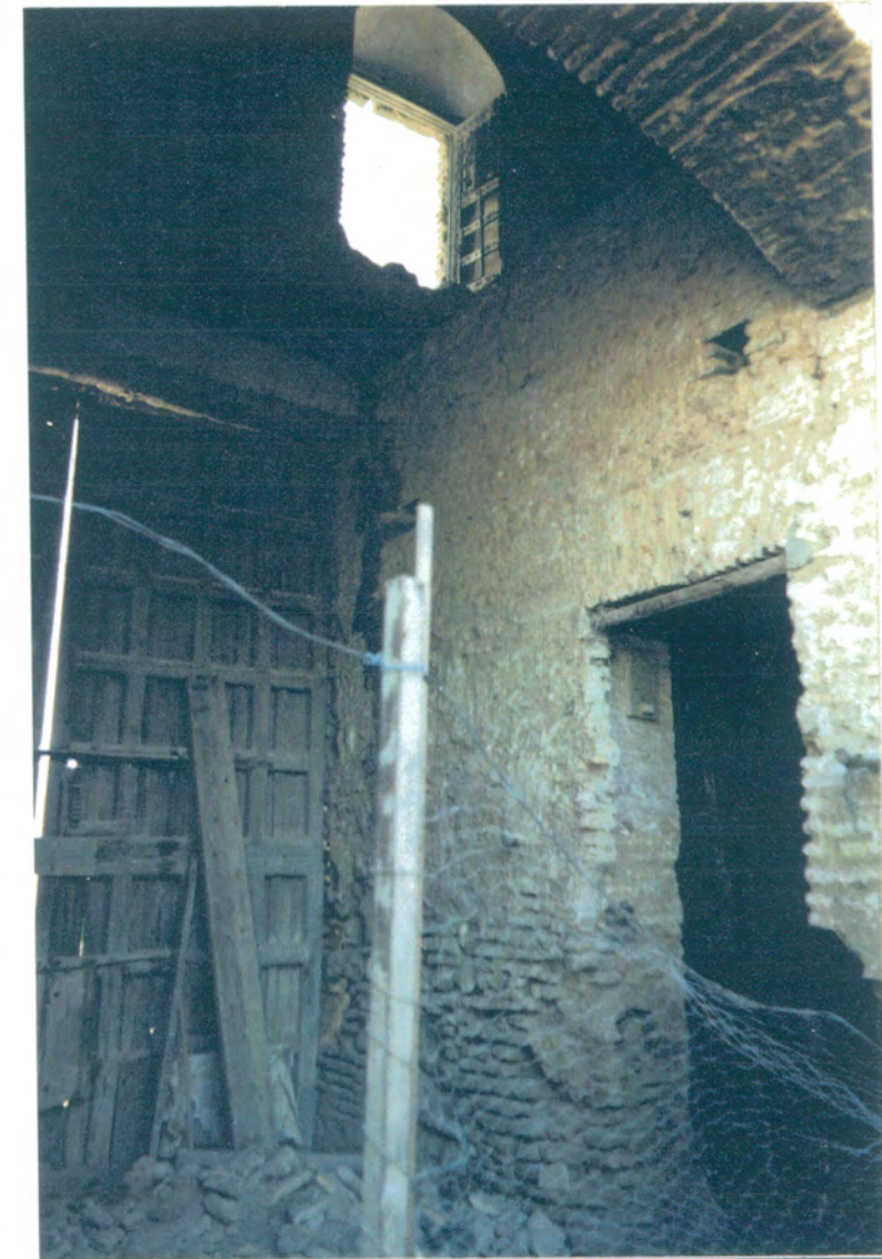
8. Zaguán de acceso al patio de la cal antes de la reforma.

APROBADO DEFINITIVAMENTE CON SU LICENCIA A LA RESOLUCION DE LA COMISION PROVINCIAL DE ORDENACION TERRESTRE Y URBANISMO. DE FECHA 26 OCT 1994 INSTITUTO VENEZOLANO DE INVESTIGACIONES CONSERVACION DE Bienes PUBLICAS Y TRANSPORTES