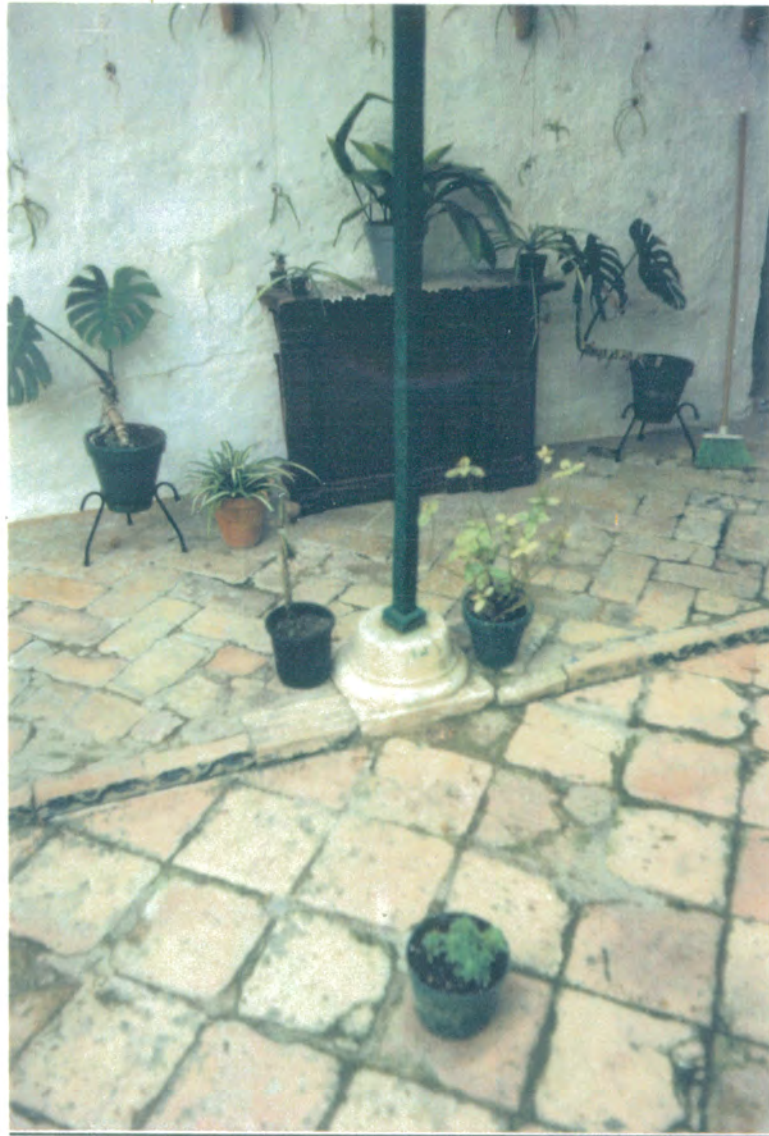
7. Detalle de solería de barro en la galería y el patio.