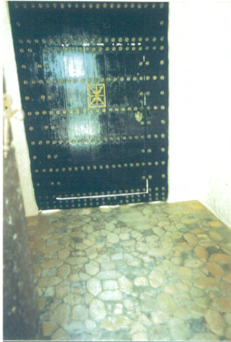
5. Zaguán de acceso al patio. Puerta de madera con clavos y mirilla de bronce.