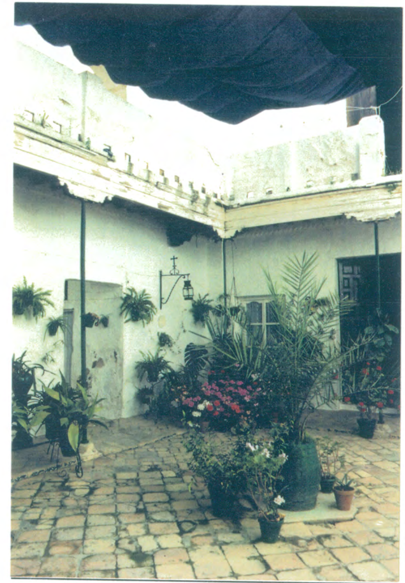
6. Vista del patio de la mayordomía.

APROBADO DEFINITIVAMENTE CON SUJECCION A LA RESOLUCION DE LA COMISION PROVINCIAL DE ORDENACION DEL TERRITORIO Y URBANISMO. DE FECHA 26 OCT 1994 JUNTA DE ANDALUCIA CONSEJERIA DE OBRAS PUBLICAS Y TRANSPORTES