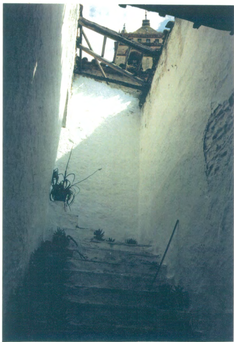
9. Escalera de acceso a la planta alta del cuerpo de fachada antes de la reforma.