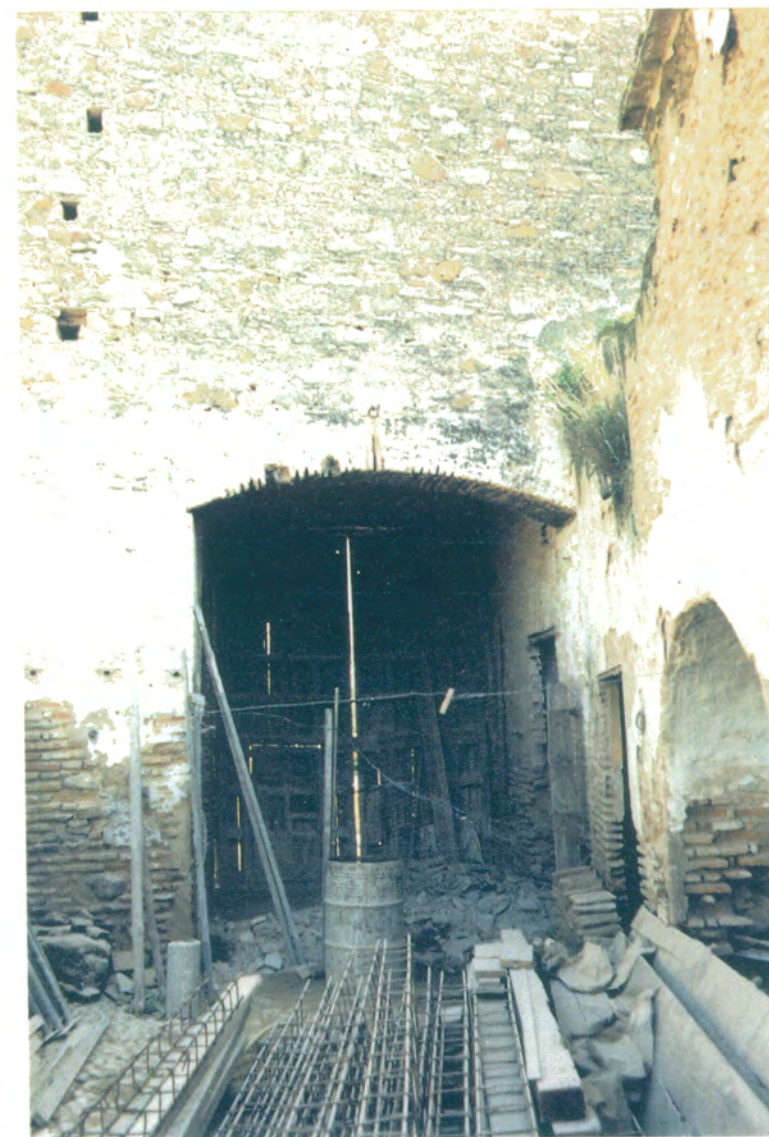
10. Detalle del patio de la cal antes de la reforma.

APROBADO DEFINITIVAMENTE CON SUJECION A LA RESOLUCION DE LA COMISION PROVINCIAL DE ORDENACION DEL TERRITORIO Y URBANISMO. DE FECHA 26 OCT. 1994 JUNTA DE ANDALUCIA CONSEJERIA DE OBRAS PUBLICAS Y TRANSPORTES