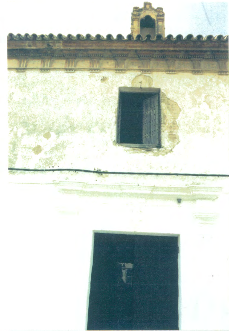
4. Portada adintelada de ladrillo, puerta de madera entre pilastras dóricas con pinjantes y rematada por entablamento; en su eje ventana de carpintería de madera con clavos de hierro, el remate de la cornisa con tríglifos, métopas y mútulos, en el tejado lucarna de ladrillo con arco lobulado entre pilastras.

APROBADO DEFINITIVAMENTE CON SUJECION A LA RESOLUCION DE LA COMISION PROVINCIAL DE ORDENACION DEL TERRITORIO Y URBANISMO. DE FECHA 26 OCT. 1994 JUNTA DE ANDALUCIA CONSEJERIA DE OBRAS PUBLICAS Y TRANSPORTES