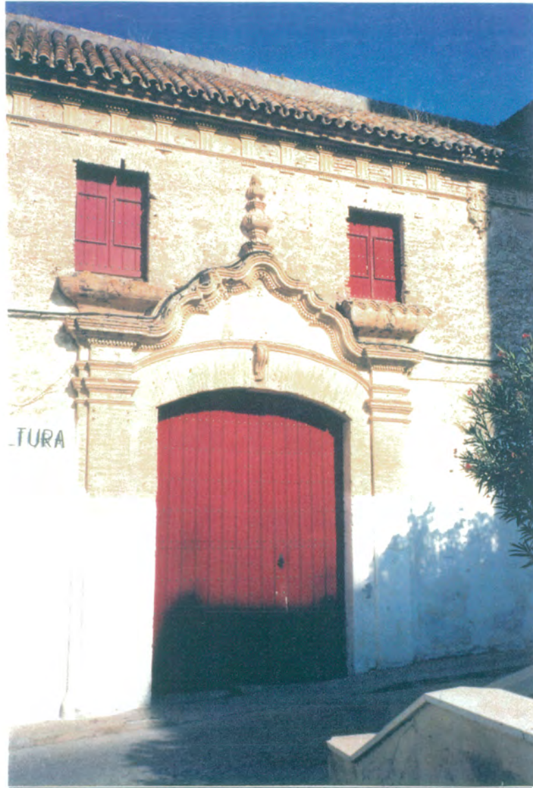
3. Portada de ladrillos con arco rebajado y ménsula en la clave, pilastras de ladrillo y frontón mistilíneo con remate.