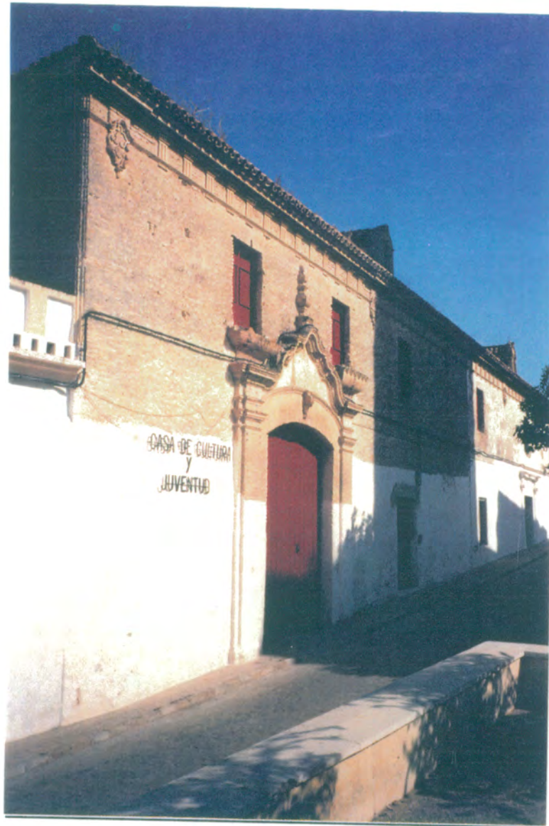
1. Fachada principal del edificio. Vista de las portadas, del muro de mampostería de piedra con hilada de ladrillo, y de las dos lucarnas.