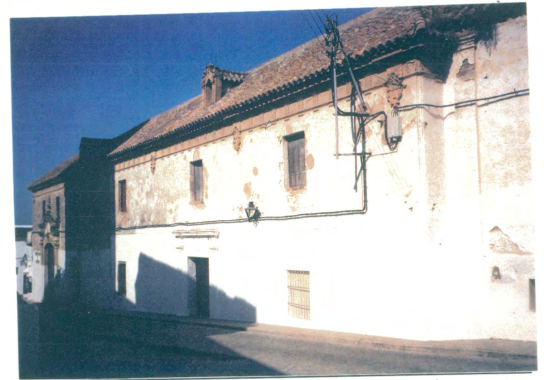
2. Fachada principal del edificio. Vistas de las portadas del muro de mampostería de piedra con hiladas de ladrillo y dos lucarnas.

APROBADO DEFINITIVAMENTE CON SUJECCION A LA RESOLUCION DE LA COMISION PROVINCIAL DE ORDENACION DEL TERRITORIO Y URBANISMO. DE FECHA 26 OCT. 1994 JUNTA DE ANDALUCIA CONSEJERIA DE OBRAS PUBLICAS Y TRANSPORTES