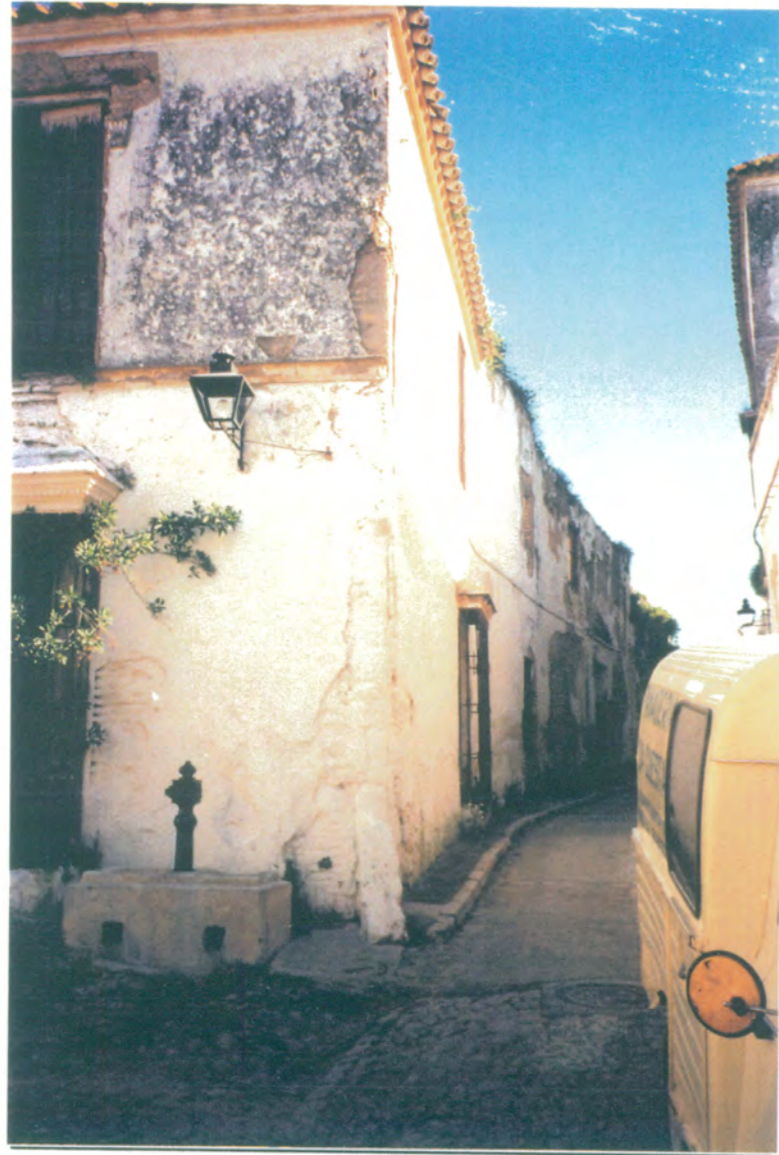
4. Vista de la C/Doctor Diego Sánchez y esquina de la barreduela.