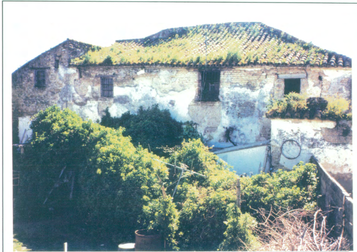
17. Fachada posterior al jardín.