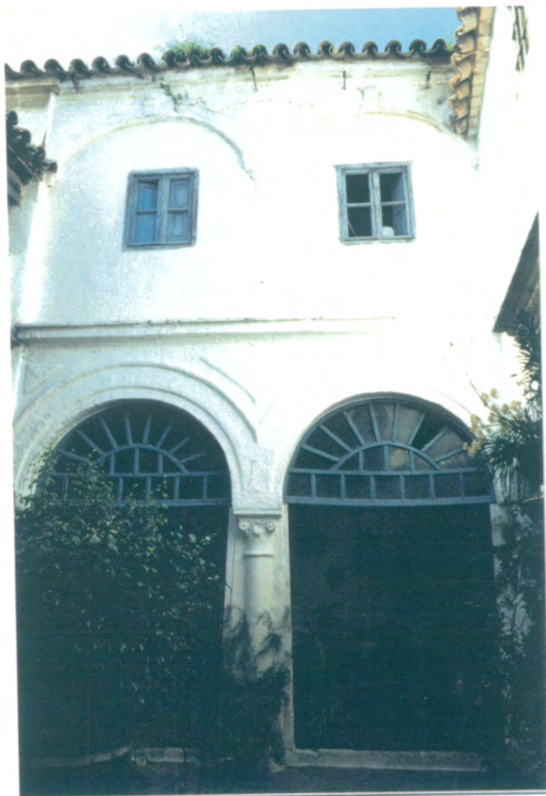
8. Frente del patio. Se observan las dos plantas separadas por una imposta, moldura y galería. En planta baja, dos arcos moldurados de medio punto sobre columnas corintias. En planta primera dos arcos rebajados sobre columnas toscanas.