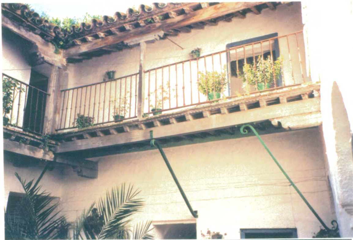
10. En el patio, galería en ángulo, adintelada con canes sobre vigas de madera, apoyada sobre tornapuntos de forja y puntales de madera; barandilla de forja.