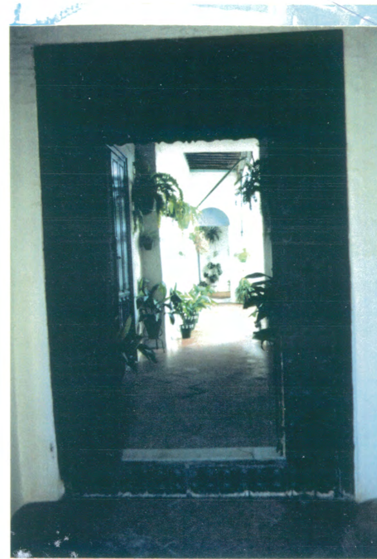
7. Vista desde el zaguan de la galería de acceso al patio.

APROBADO DEFINITIVAMENTE CON SUJECION A LA RESOLUCION DE LA COMISION PROVINCIAL DE ORDENACION DEL TERRITORIO Y URBANISMO DE FECHA 26 OCT. 1994 JUNTA DE ANDALUCIA CONSEJERIA DE OBRAS PUBLICAS Y TRANSPORTES