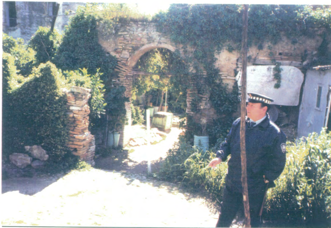
18. Vista del jardín.