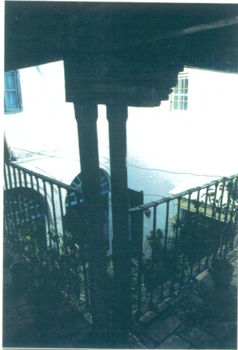
13. Vista del ángulo de la galería desde la planta alta.