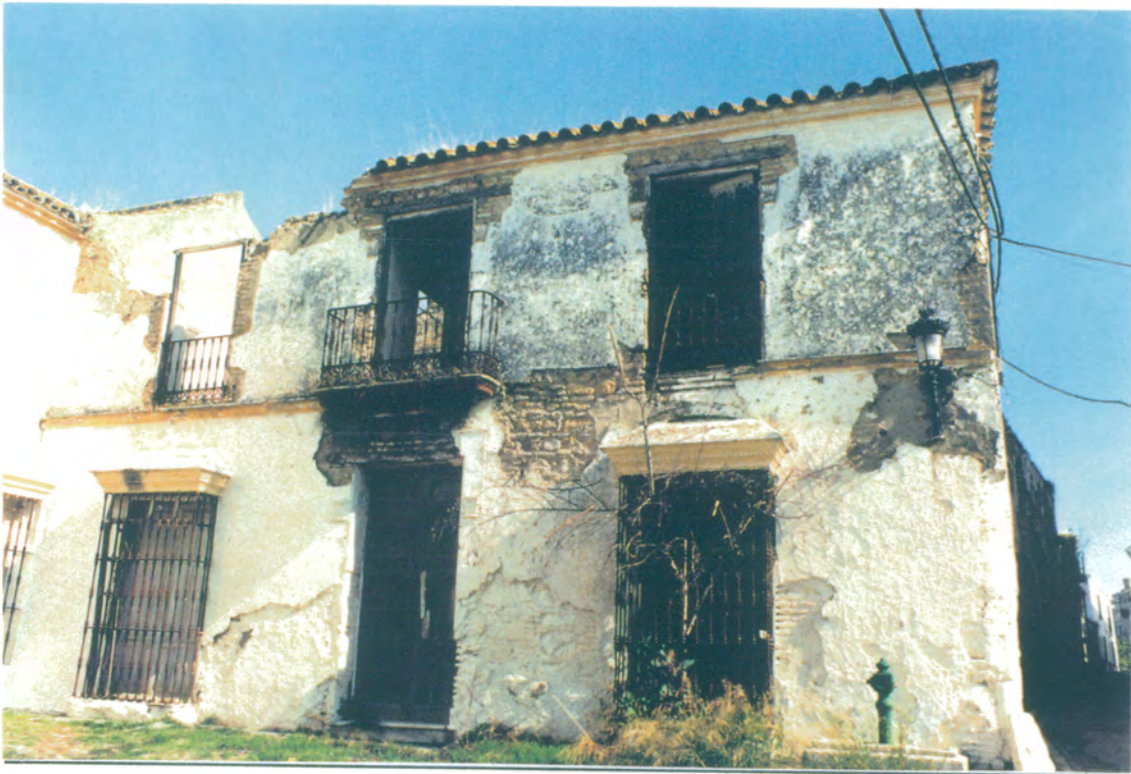
2. En barreduela de C/ Doctor Diego Sánchez, fachada lateral del S. XIX en estado de ruina.