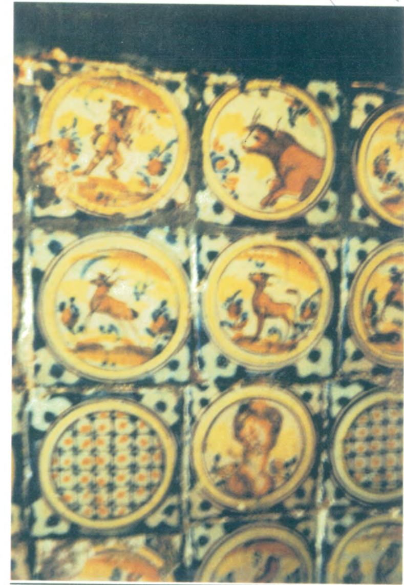
19. Detalle de azulejos de cerámica con motivos de montería del S. XVIII, situados en la cocina.

APROBADO DEFINITIVAMENTE CON SUJECION A LA RESOLUCION DE LA COMISION PROVINCIAL DE ORDENACION DEL TERRITORIO Y URBANISMO. DE FECHA 26 OCT. 1994 JUNTA DE ANDALUCIA CONSEJERIA DE OBRAS PUBLICAS Y TRANSPORTES