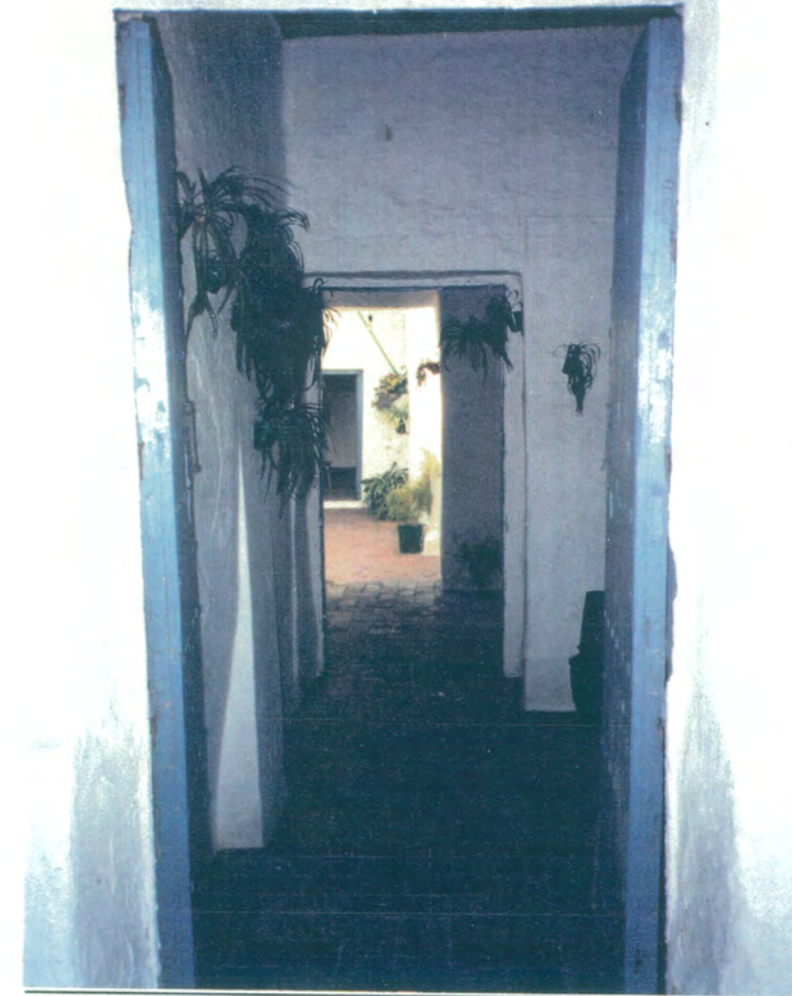
16. Desde la puerta de salida al patio interior, hacia el primer patio.

APROBADO DEFINITIVAMENTE CON SUJECION A LA RESOLUCION DE LA COMISION PROVINCIAL DE ORDENACION DEL TERRITORIO Y URBANISMO. DE FECHA 26 OCT. 1994 JUNTA DE ANDALUCIA CONSEJERIA DE OBRAS PUBLICAS Y TRANSPORTES