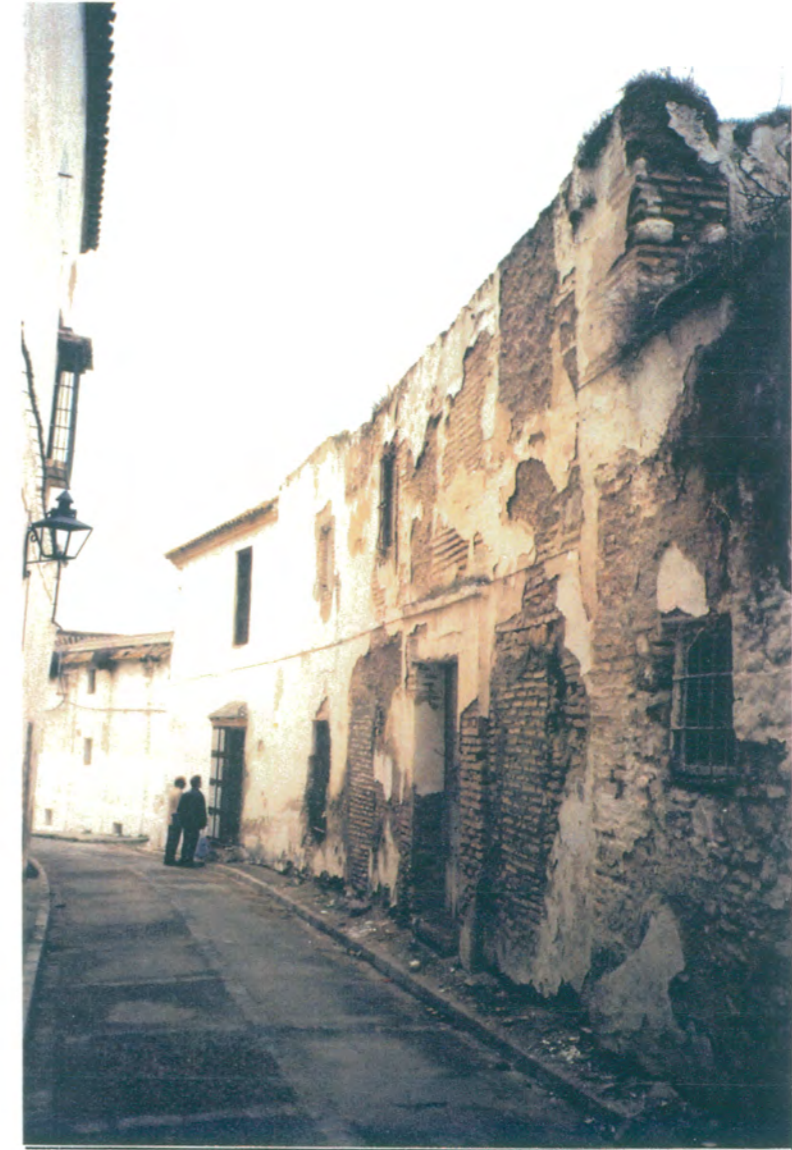
5. Fachada a C/Doctor Diego Sánchez.

APROBADO DEFINITIVAMENTE CON SUJECION A LA RESOLUCION DE LA COMISION PROVINCIAL DE ORDENACION DEL TERRITORIO Y URBANISMO. DE FECHA JUNTA DE ANDALUCIA CONSEJERIA DE OBRAS PUBLICAS Y TRANSPORTES