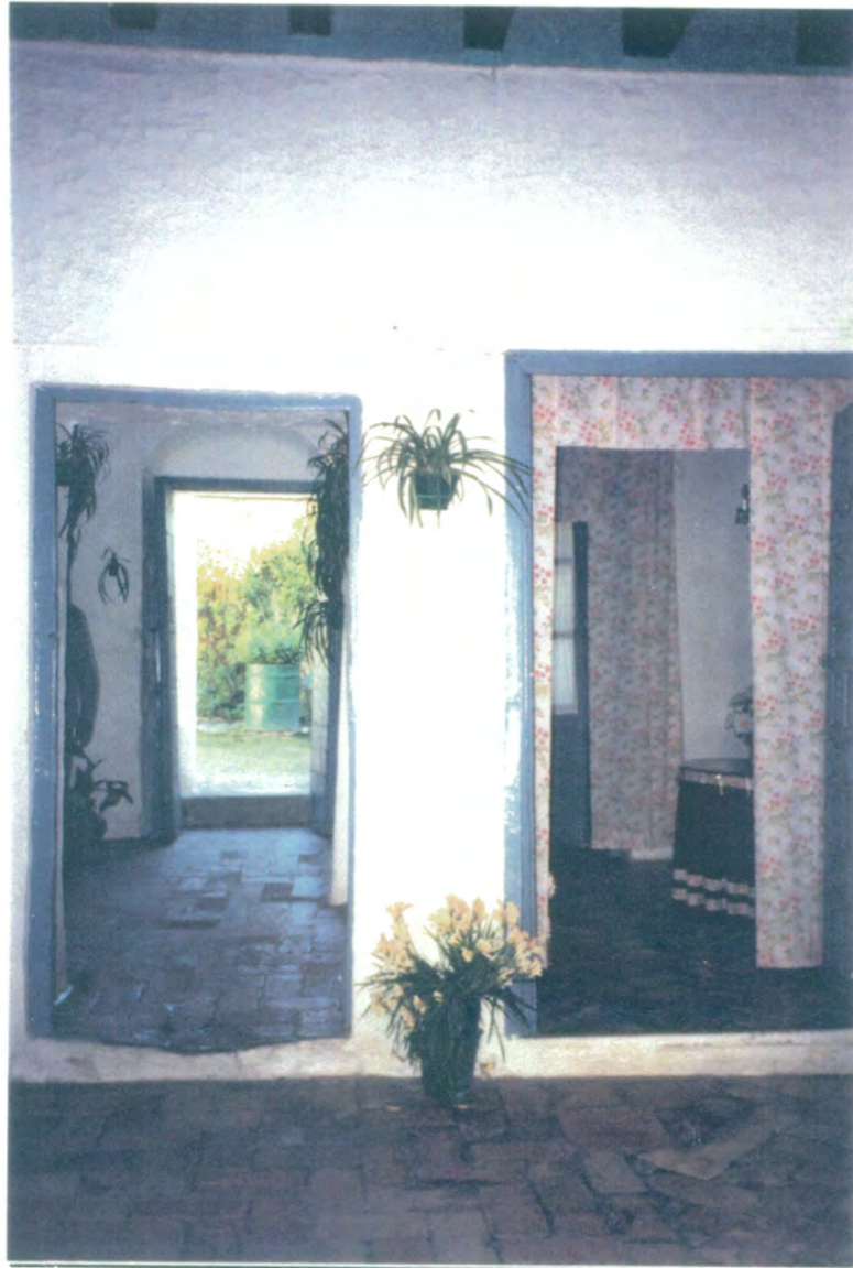
15. Vista desde el patio, hacia el patio interior.