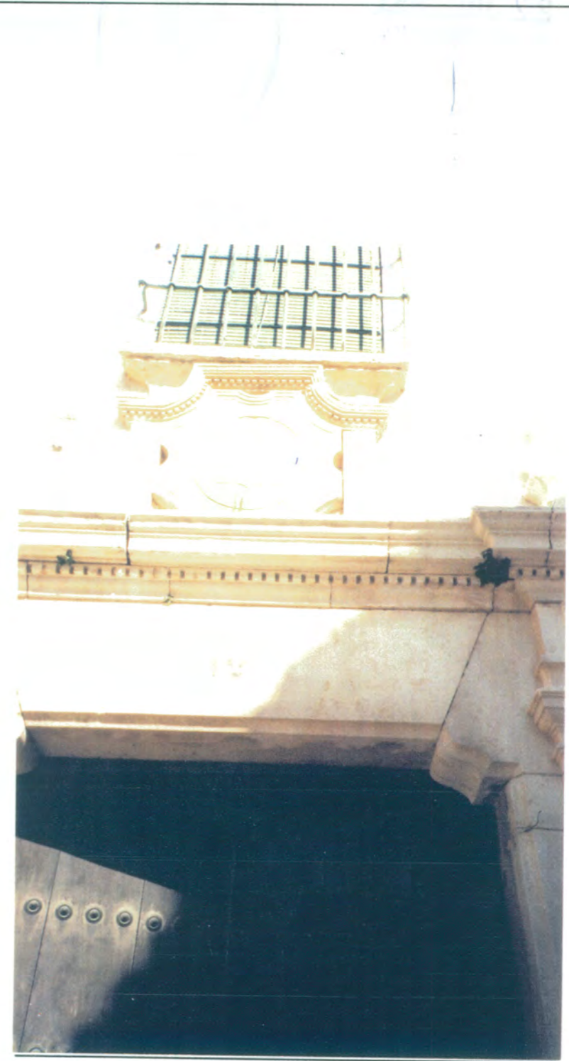
3. Detalle del dintel y escudo de la portada del nº 12 de C/Doctor Diego Sánchez.

APROBADO DEFINITIVAMENTE CON SUJECCION A LA RESOLUCION DE LA COMISION PROVINCIAL DE ORDENACION DEL TERRITORIO Y URBANISMO. DE FECHA 26 OCT. 1994 JUNTA DE ANDALUCIA CONSEJERIA DE OBRAS PUBLICAS Y TRANSPORTES