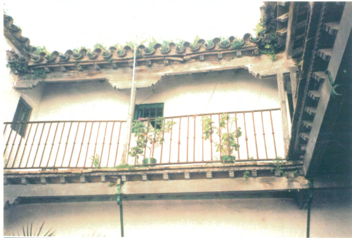
11. Vista del ángulo de la galería superior desde la parte frontal del patio en planta alta.