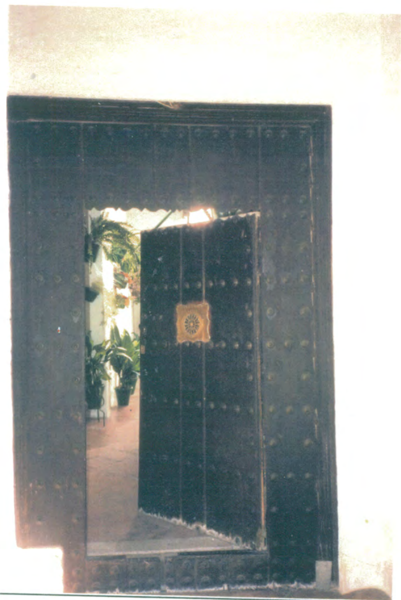
6. Portón de entrada de madera con clavos y mirilla de bronce, en el nº 12 de la barreduela de C/ Doctor Diego Sánchez.