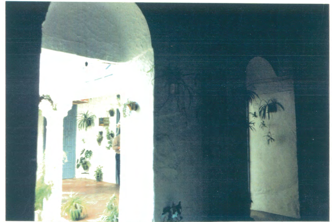
12. Vista de la gelería frontal del patio desde el lateral derecho del mismo.

APROBADO DEFINITIVAMENTE CON SUJECION A LA RESOLUCION DE LA COMISION PROVINCIAL DE ORDENACION DEL TERRITORIO Y URBANISMO. DE FECHA 26 OCT. 1994 JUNTA DE ANDALUCIA CONSEJERIA DE OBRAS PUBLICAS Y TRANSPORTES