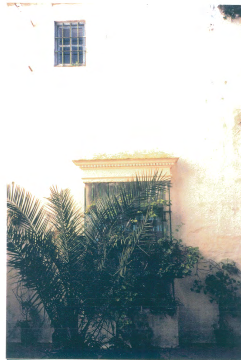
9. Lateral derecho del patio, ventana volada con cornisa sobre cerrajería de hierro forjado.

APROBADO DEFINITIVAMENTE CON SUJECION A LA RESOLUCION DE LA COMISION PROVINCIAL DE ORDENACION DEL TERRITORIO Y URBANISMO. DE FECHA 26 OCT. 1994 JUNTA DE ANDALUCIA COMISION PROVINCIAL DE OBRAS PUBLICAS Y TRANSPORTES