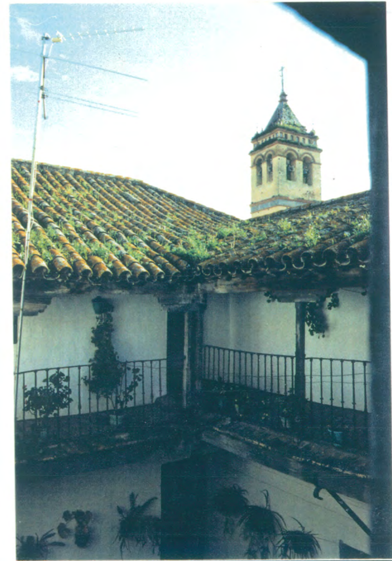
14. Desde la galería superior del frontal del patio, vista del ángulo de la galería opuesta.

APROBADO DEFINITIVAMENTE CON SUJECION A LA RESOLUCION DE LA COMISION PROVINCIAL DE ORDENACION DEL TERRITORIO Y URBANISMO. DE FECHA 26 OCT. 1994 JUNTA DE ANDALUCIA CONSEJERIA DE OBRAS PUBLICAS Y TRANSPORTES