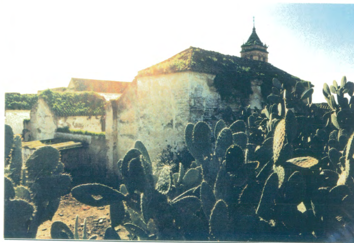
11. Vista general del lado Norte del edificio, desde la muralla.

APROBADO DEFINITIVAMENTE CON SUJECION A LA RESOLUCION DE LA COMISION PROVINCIAL DE ORDENACION DEL TERRITORIO Y URBANISMO. DE FECHA 26 OCT. 1994 JUNTA DE ANDALUCIA CONSEJERIA DE OBRAS PUBLICAS Y TRANSPORTES