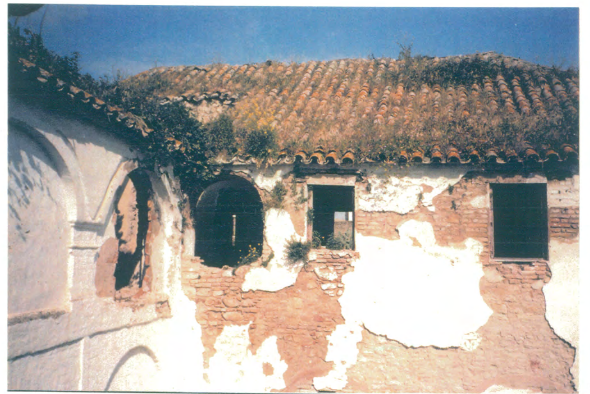
26. Planta alta de fachadas norte, oeste, en estado de ruina.