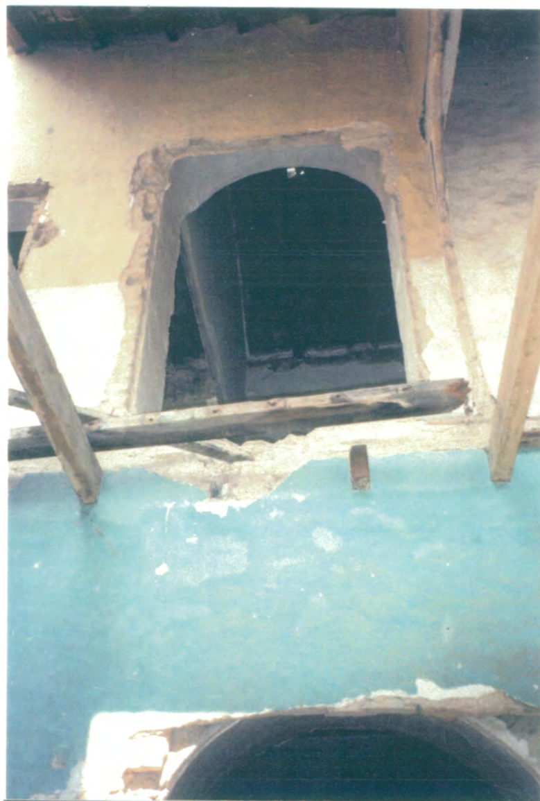
27. Detalle de habitación que da al patio principal en su lado norte.