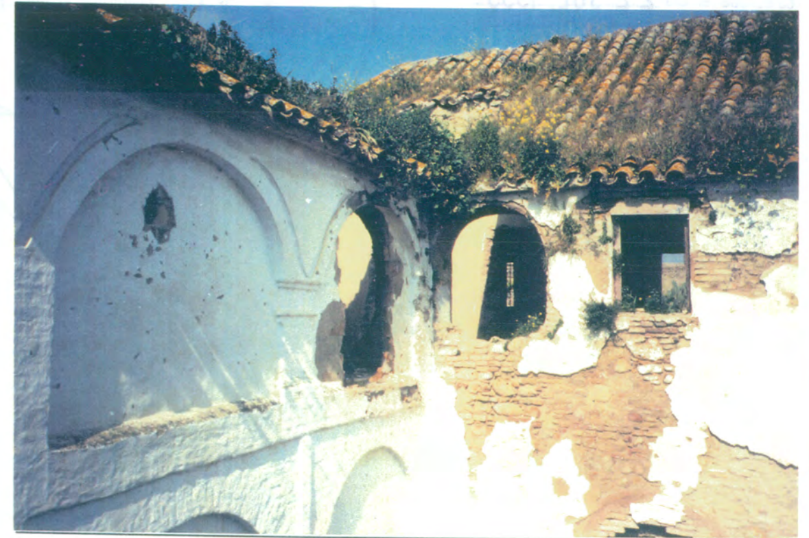
15. Detalle del patio principal, ángulo formado por las fachadas norte y oeste en planta alta.