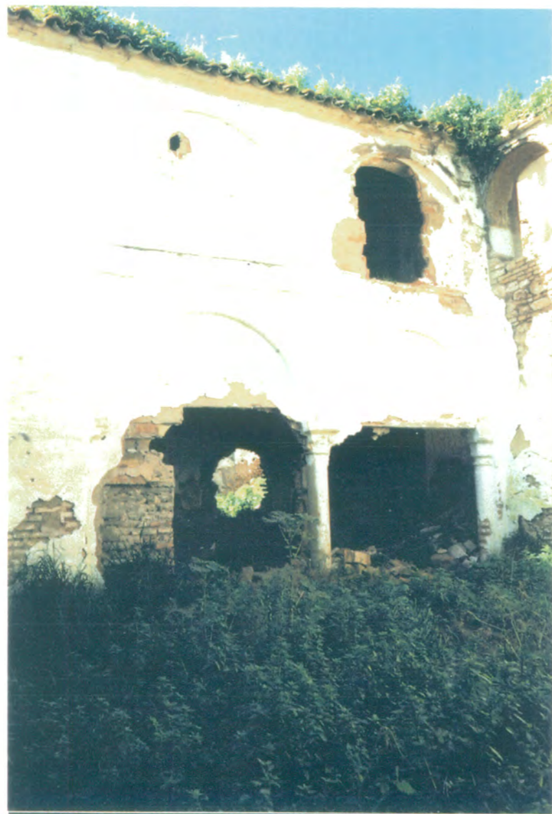
17. Vista de la fachada oeste del patio principal.