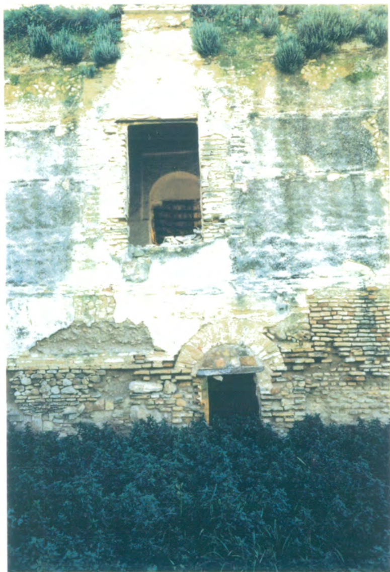
10. Detalle de fachada posterior , vista desde la que sería la huerta.