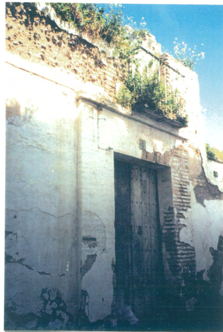
2. Portada de entrada adintelada, entre pilastras de ladrillo, puerta de madera y balcón en planta alta.

APROBADO DEFINITIVAMENTE CON SUJECION A LA RESOLUCION DE LA COMISION PROVINCIAL DE ORDENACION DEL TERRITORIO Y URBANISMO.