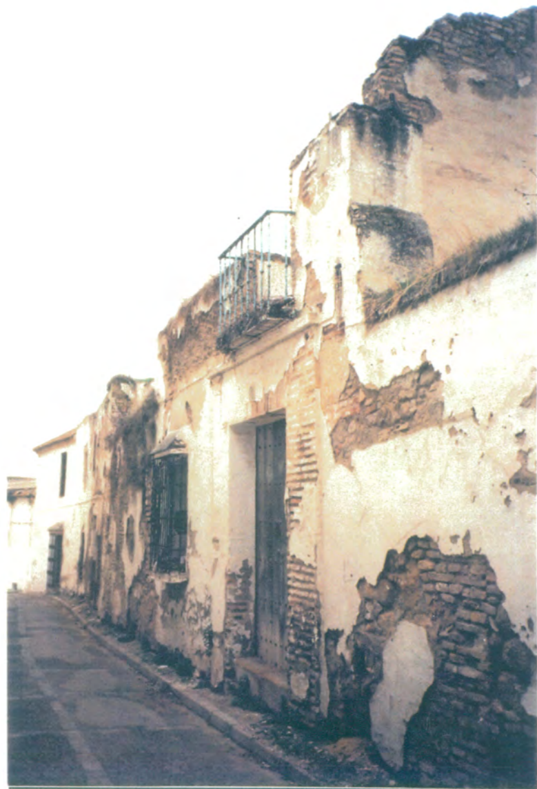
1. Fachada principal. Construcción de argamaza y mampostería de ladrillo. Totalmente en ruina.