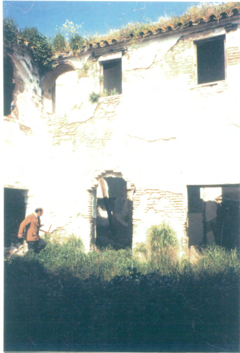
14. Angulo del patio principal formado por las fachadas norte y oeste.