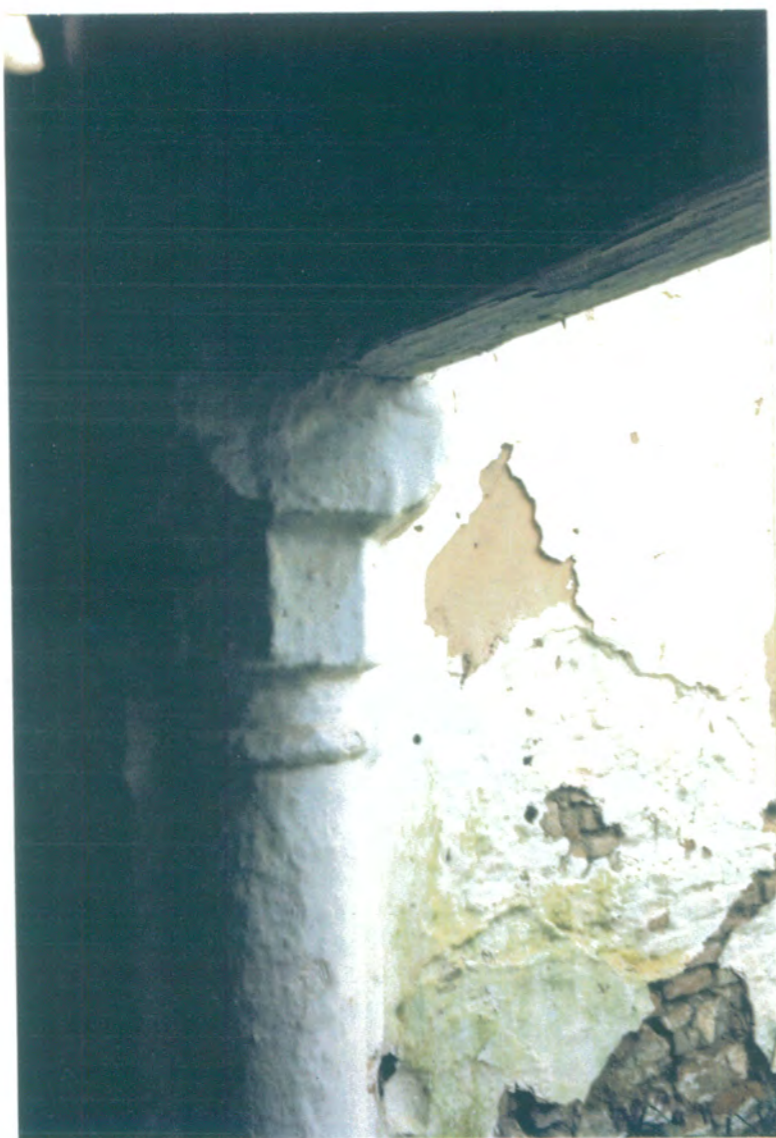
21. Detalle de columna mudéjar y capitel.