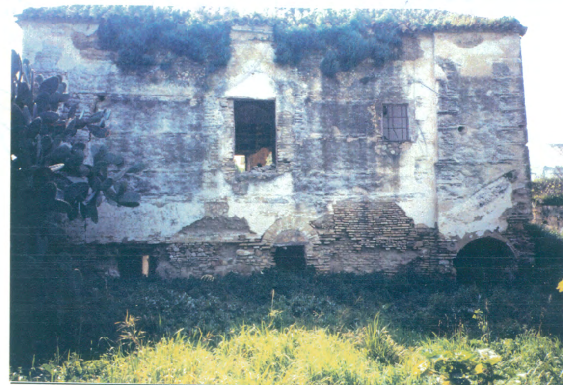
8. Fachada posterior, vista desde lo que sería la huerta.