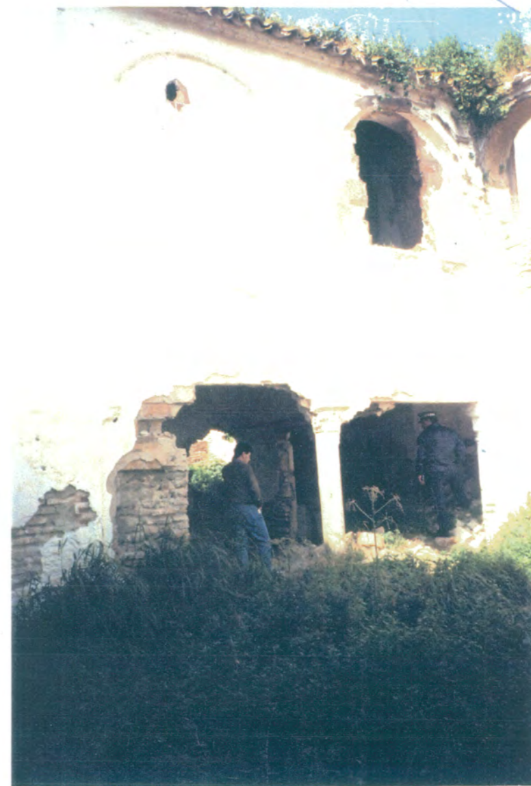
18. Fachada oeste del patio principal, es de dos plantas, separadas por una imposta de ladrillo que enmarca los arcos sobre columnas existentes en ambas plantas.

APROBADO DEFINITIVAMENTE CON SUJECION A LA RESOLUCION DE LA COMISION PROVINCIAL DE ORDENACION DEL TERRITORIO Y URBANISMO. DE FECHA 26 OCT. 1994 JUNTA DE ANDALUCIA CONSEJERIA DE OBRAS PUBLICAS Y TRANSPORTES