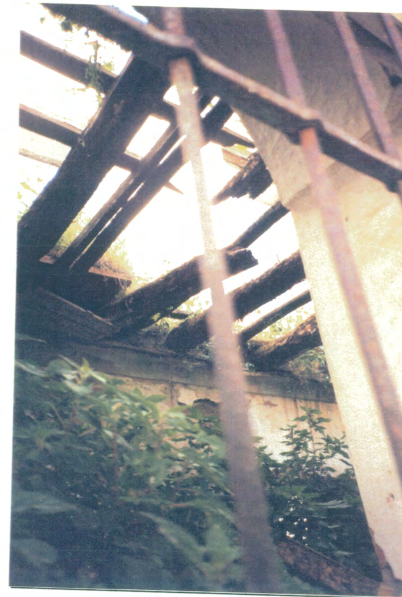
4. Detalle de resto de techumbre, en la primera crujía de la fachada principal, en ruina, donde se observa estuvo formada por rollizos, tablazón y ladrillo por tabla.

APROBADO DEFINITIVAMENTE CON SUJECCION A LA FICHA Nº 17 DE LA COMISION PROTECCION Y CONSERVACION DEL TERRITORIO HISTORICO DE FECHA 26 OCT. 1994 JUNTA DE ANDALUCIA CONSEJERIA DE OBRAS PUBLICAS Y TRANSPORTES