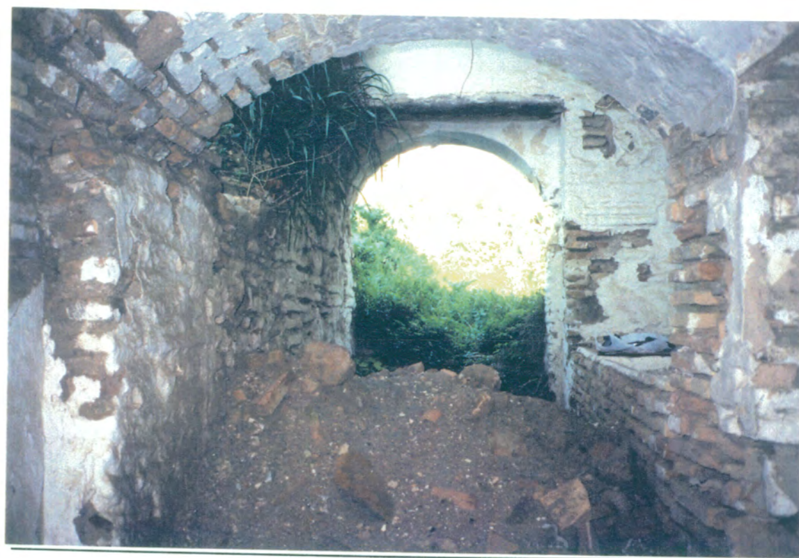
9. Detalle de la salida posterior. Se observa en primer término arco abovedado de ladrillo y, al fondo, la puerta adintelada sobre arco de medio punto que deja paso a la huerta.

APROBADO DEFINITIVAMENTE CON SUJECION A LA RESOLUCION DE LA COMISION DE ENLACE Y COORDINACION DEL TERRITORIO Y URBANISMO. DE FECHA 26 OCT. 1994 JUNTA DE ANDALUCIA CONSEJERIA DE OBRAS PUBLICAS Y TRANSPORTES