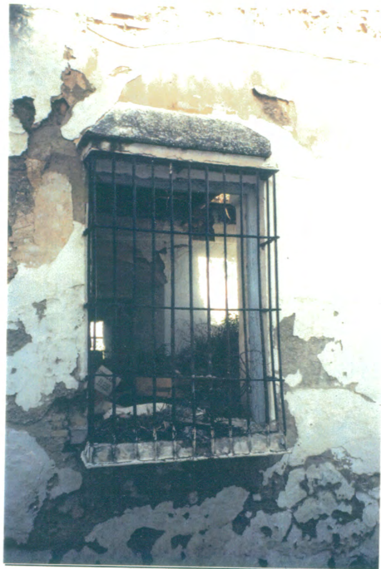
3. Detalle de ventana en fachada principal, cerrajería volada de hierro forjado.