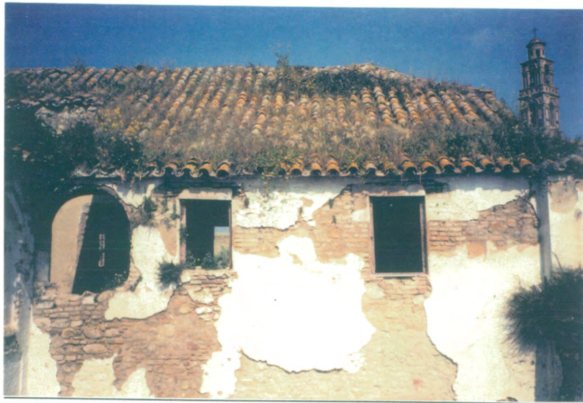
23. Detalle de planta alta, fachada norte, patio principal.