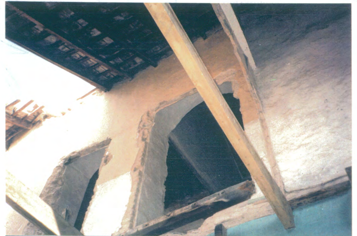
25. Planta alta. Desde la planta baja de habitación que da al patio principal, en su lado norte, un estado de ruina.

JUNTA DE ANDALUCIA CONSEJERIA DE OBRAS PUBLICAS Y TRANSPORTES