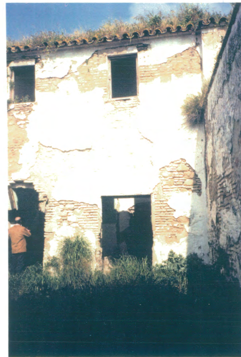
22. Angulo del patio principal formado por las fachadas norte y este.

APROBADO DEFINITIVAMENTE CON SUJECION A LA RESOLUCION DE LA COMISION PROVINCIAL DE ORDENACION DEL TERRITORIO Y URBANISMO. DE FECHA 26 OCT. 1994 JUNTA DE ANDALUCIA CONSEJERIA DE OBRAS PUBLICAS Y TRANSPORTES