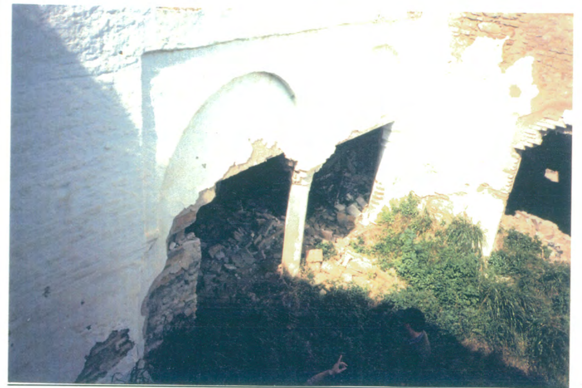
16. Desde la planta alta, vista del mismo ángulo de la fotografía anterior, de la planta baja del patio.