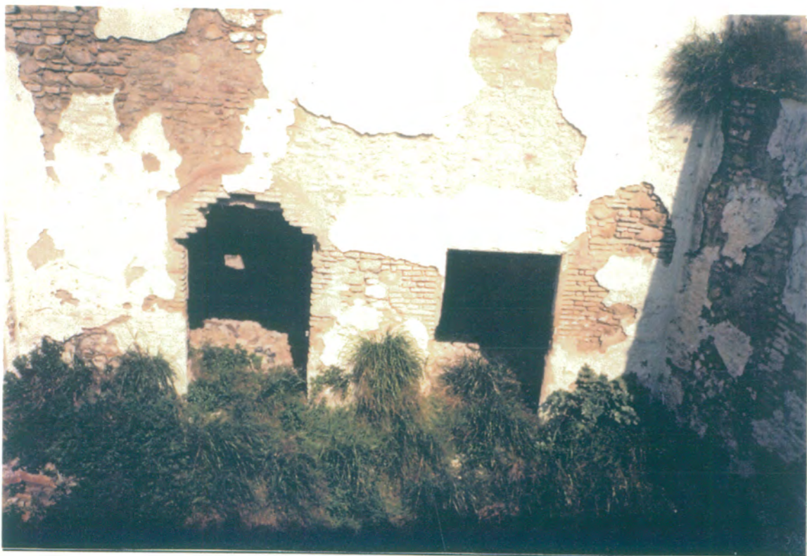
24. Detalle de planta baja, fachada norte, patio principal.

APROBADO DEFINITIVAMENTE CON REFERENCIA A LA RESOLUCION DE LA COMISION PROVINCIAL DE ORDENACION DE TERRITORIO Y URBANISMO.