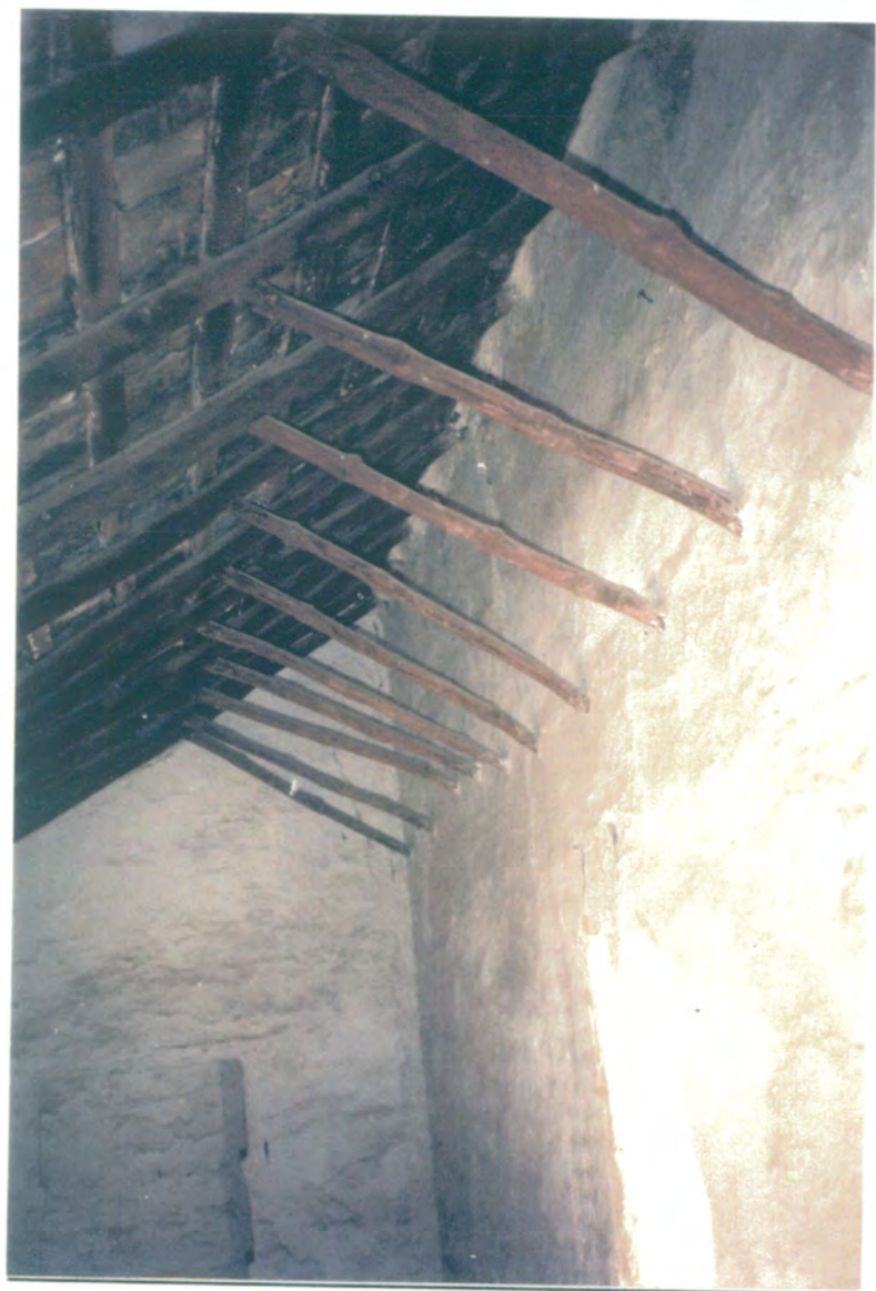
29. Vista de la planta alta de la última crujía del lado norte, formación de la cubierta con rollizos, tablazón, ladrillo por tabla y tornapuntos de madera.