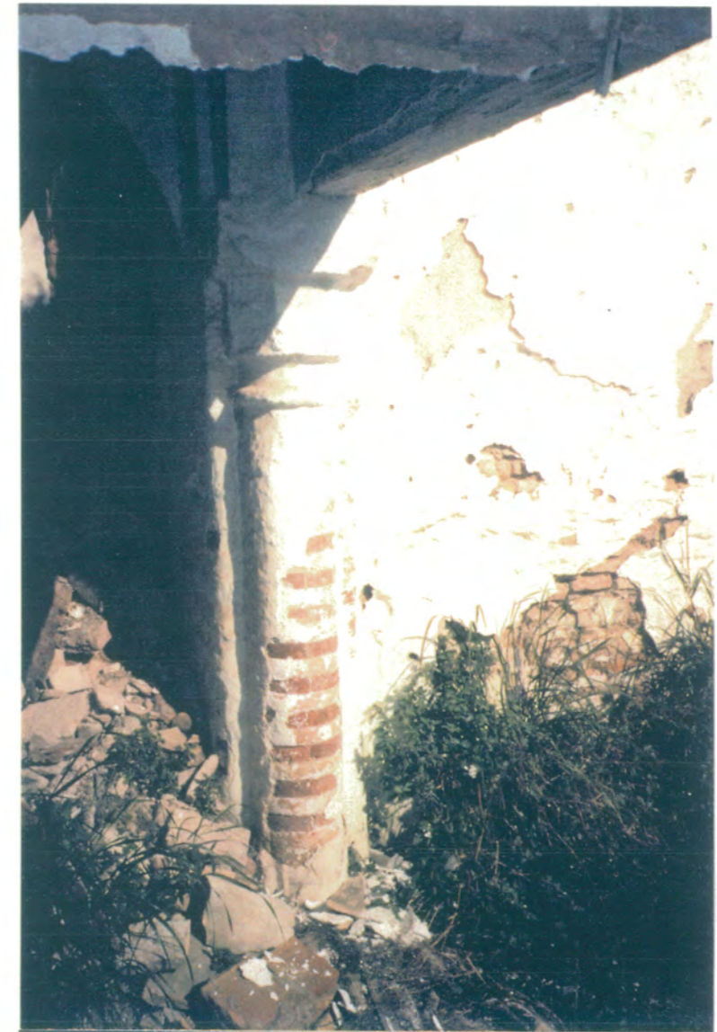
20. Desde el interior, columnas y capitel mudéjar del patio principal.

APROBADO DEFINITIVAMENTE CON SUECION A LA RESOLUCION DE LA COMISION PROVINCIAL DE ORDENACION DEL TERRITORIO Y URBANISMO. DE FECHA 26 OCT. 1994 JUNTA DE ARQUITECTA CONDUCTORA DE OBRAS PLUMBOS Y TRANSICIONES