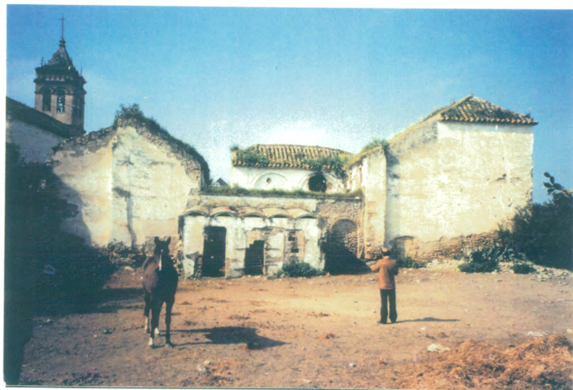
7. Vista desde el solar existente en C/ Doctor Diego Sánchez nº 10.