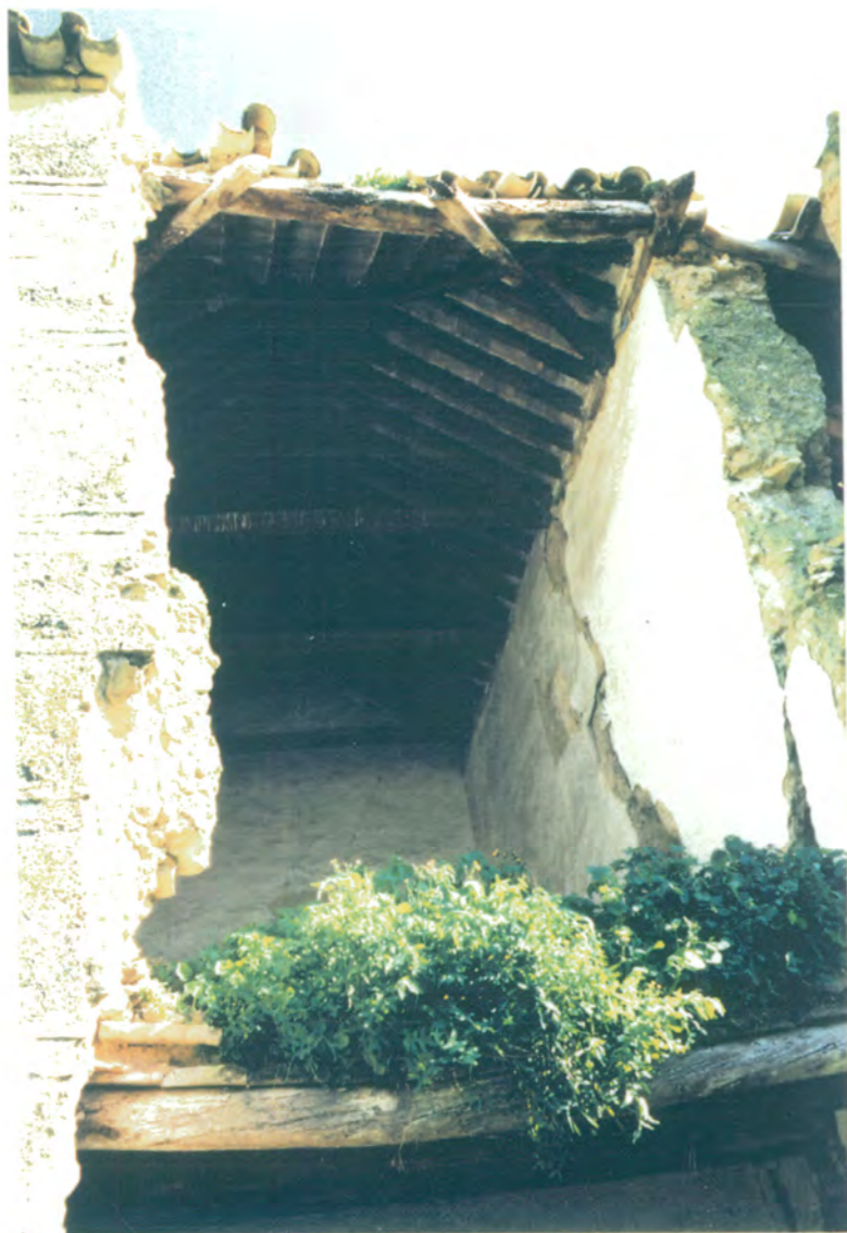
5. Detalle de techumbre de la primera crujía de la fachada posterior y muros del lado oeste.