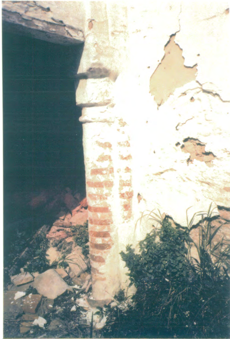
19. Desde el patio principal, detalle de pilastra y columna mudéjar, donde apoya un dintel de madera.