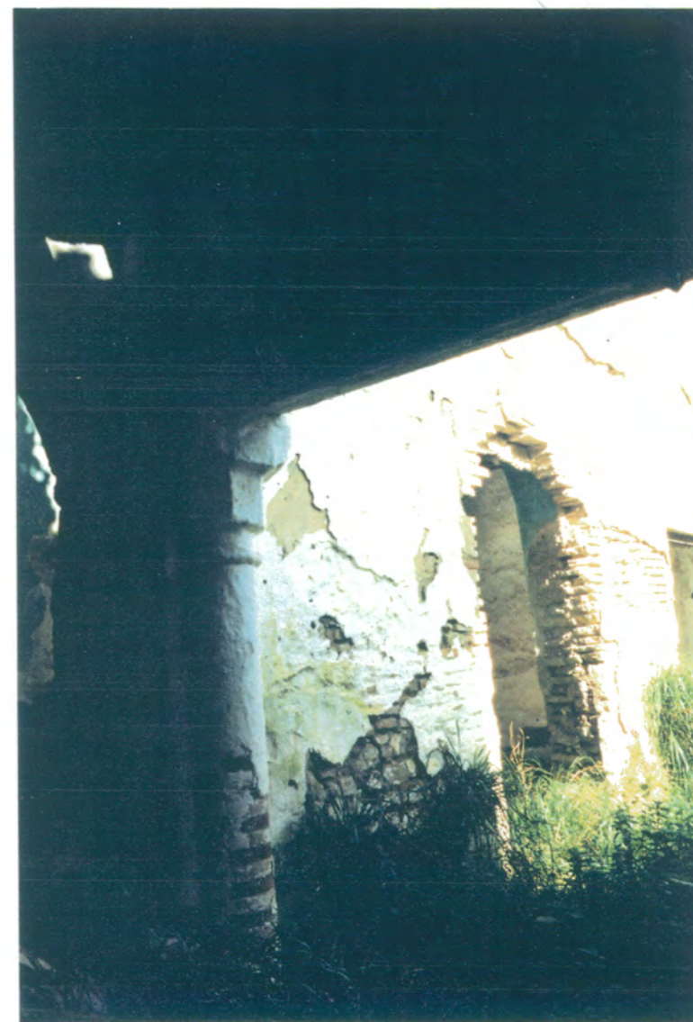
13. Vista de la fachada norte del patio principal desde la nave oeste.

APROBADO DEFINITIVAMENTE CON SUJECCION A LA TUTORIA DE LA COMISION PROVINCIAL DE ORDENACION DEL TERRITORIO Y URBANISMO DE FECHA 26 OCT. 1994 CONSEJERIA DE OBRAS PUBLICAS Y TRANSPORTES