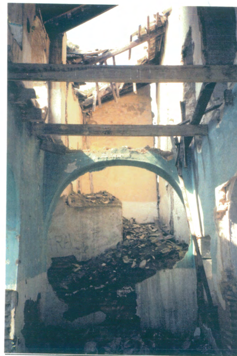
28. Vista de la crujiá del lado norte, que da al patio principal, hacia el lugar donde estuvo el arranque de la escalera para subir a la planta alta.

APROBADO DEFINITIVAMENTE CON SUJECION A LA RESOLUCION DE LA COMISION PROVINCIAL DE ORDENACION DEL TERRITORIO Y URBANISMO. DE FECHA 26 OCT. 1994 JUNTA DE ANDALUCIA CONSEJERIA DE OBRAS PUBLICAS Y TRANSPORTES