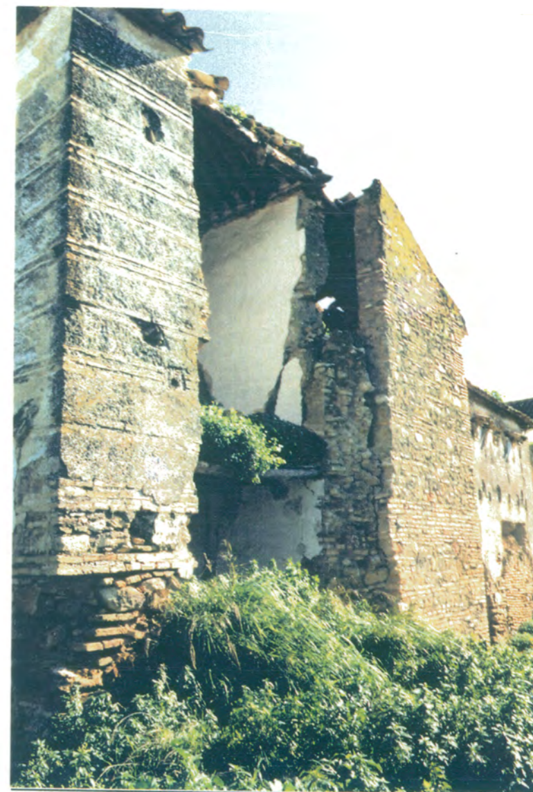
6. Detalle del muro del lado oeste del ala Norte fachada posterior.

DEPARTAMENTO DE CULTURA Y TURISMO CONSEJO REGULADOR DEL PATRIMONIO HISTÓRICO DE MARCHENA DECRETO 26 OCT. 1994 MARCHENA DE BURGOS COMISIÓN DE OBRAS DE RESTAURACIÓN Y TRANSPORTES