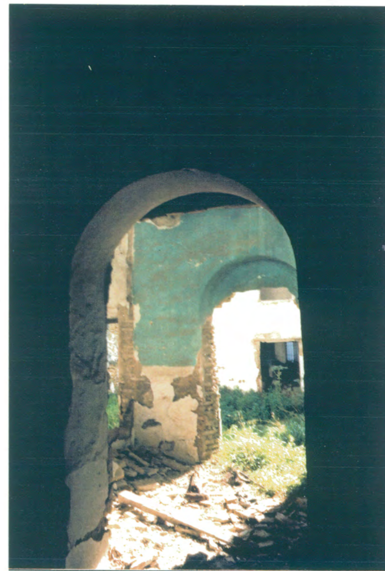
30. Vista desde la primera crujía de fachada posterior, hacia la primera de la fachada a C/ Doctor Diego Sánchez.

APROBADO DEFINITIVAMENTE CON SUSCIPCIÓN A LA RESOLUCIÓN DE LA COMISIÓN PROVINCIAL DE ORDENACIÓN DEL TERRITORIO Y URBANISMO DE FECHA 26 OCT. 1994 JUNTA DE ANDALUCÍA CONSEJO REGULADOR DE Bienes Culturales