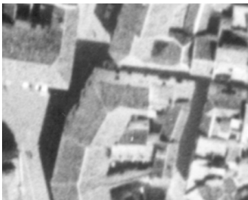
Foto aérea vertical