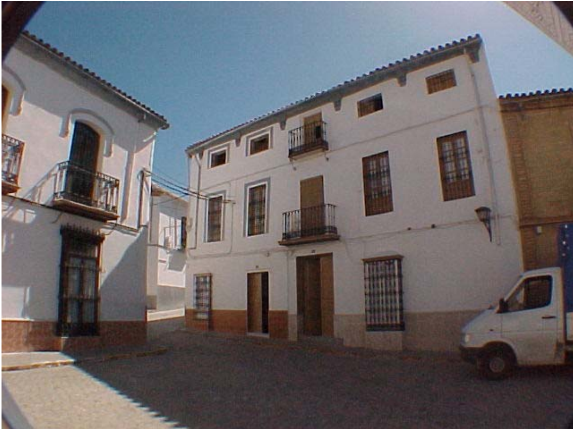
Fachada a Plaza San Antonio

Núm. Ficha: 10 y 11 referencia 30-01 Y 02