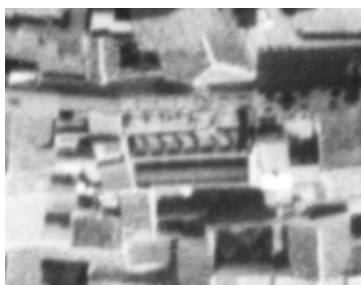
Foto Aérea Vertical