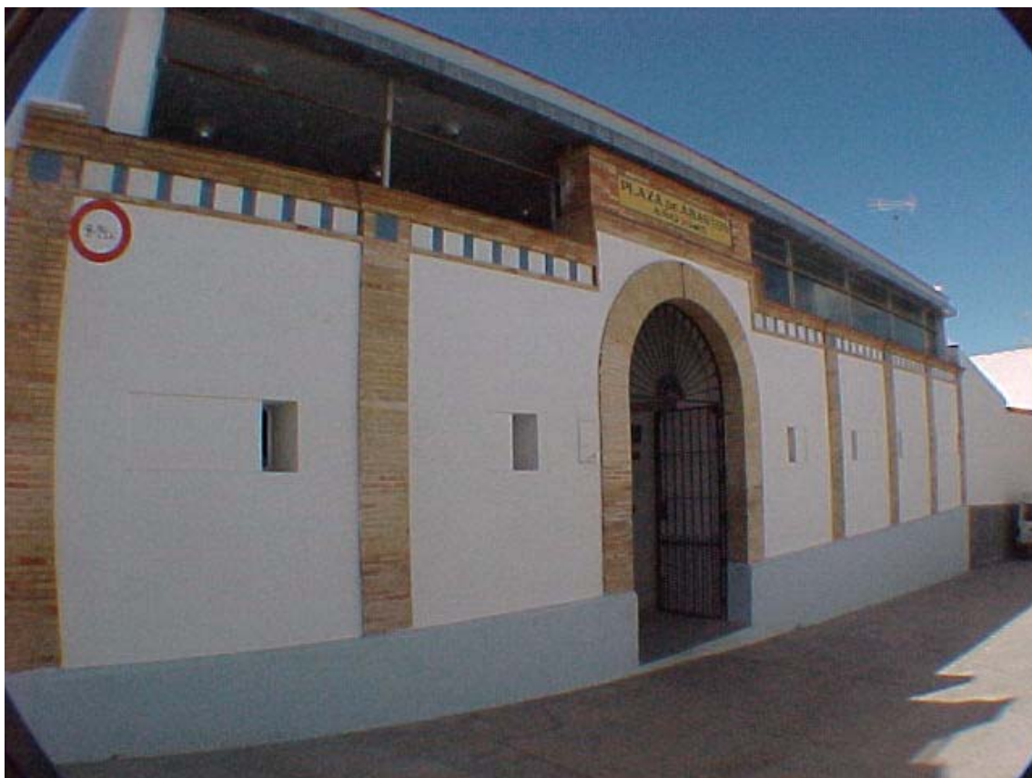
Fachada calle Sevilla